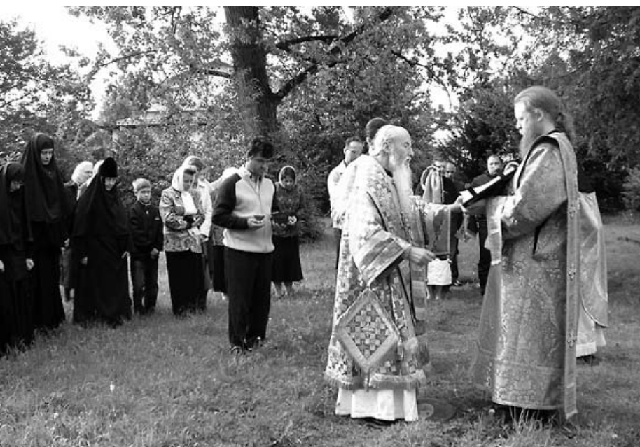
Молебен в Мюнхене

Богослужение в Германии иногда совершается на немецком языке. При этом преимущественно мы используем все-таки церковно-славянский язык. Но есть разные подходы к этому вопросу, в зависимости от способностей священника, от потребностей прихода. Во многих приходах читают Евангелие и Апостол, возглашают одну-две ектении на двух языках, а что-то – по-немецки. Есть приходы, где службы совершаются по большей части на немецком, но с некоторыми вставками по-славянски. Где-то раз в месяц служат только по-немецки. Есть приходы, где немецкий язык звучит по субботам, чтобы от храма не отпали люди, которые имеют возможность ходить туда только раз в неделю и не понимают церковно-славянского языка. То есть мы поощряем самые разные подходы, потому что понимаем: мы должны рассчитывать на то, что через десять-пятнадцать лет те люди, которые сейчас наполняют наши храмы, а также их дети, уже не будут владеть рус-